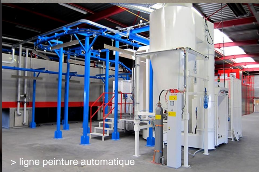
> ligne peinture automatique