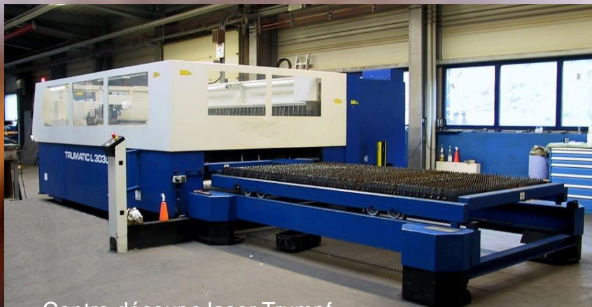
> Centre découpe laser Trumpf